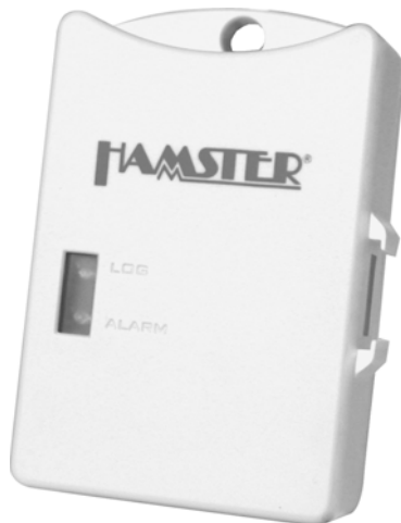
Datenlogger HAMSTER-E ET1; Art.-Nr. 4901