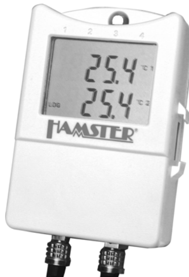
Datenlogger HAMSTER-E ET2; Art.-Nr. 4902