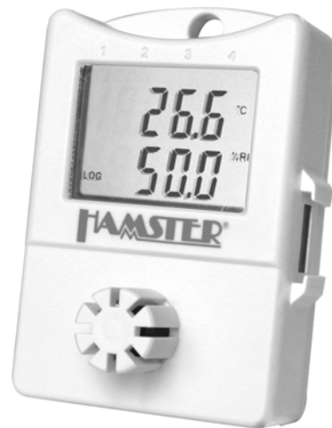
Datenlogger HAMSTER-E EHT1; Art.-Nr. 4903